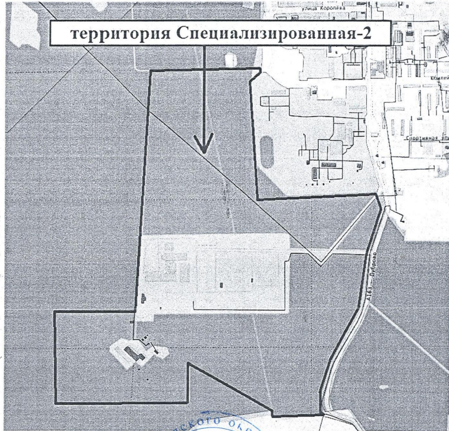
Схема расположения территории Специализированная-2, расположенной вблизи деревни Дуброво вне границ населённых пунктов городского округа Щёлково Московской области

Начальник Отдела архитектуры и градостроительства Администрации городского округа Щёлково