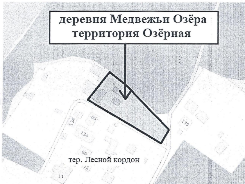
Схема расположения территории Озёрная, расположенной в кадастровом квартале 50:14:0040345 в деревне Медвежьи Озёра городского округа Щёлково Московской области

Начальник Отдела архитектуры и градостроительства Администрации городского округа Щёлково