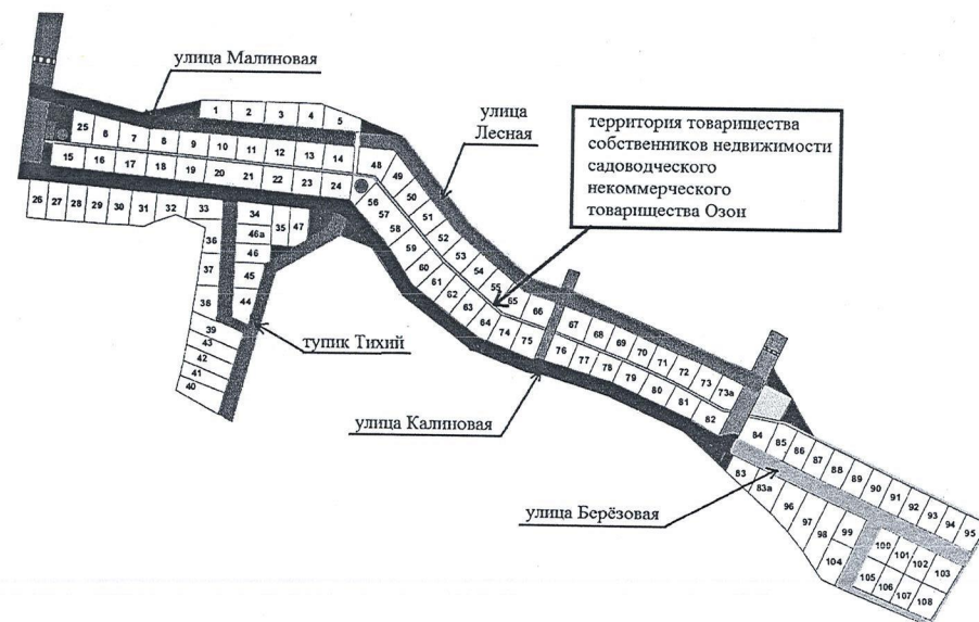
Схема присвоения наименования территории и элементам улично-дорожной сети, расположенных в кадастровом квартале 50:14:0020201 территория товарищества собственников недвижимости садоводческого некоммерческого товарищества Озон городского округа Щёлково Московской области

Начальник Отдела архитектуры и градостроительства Администрации городского округа Щёлково