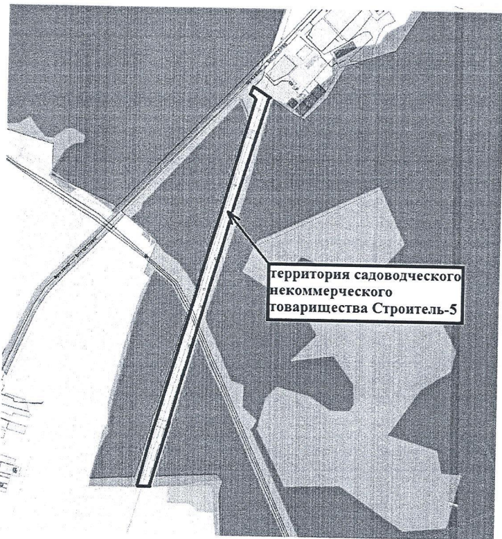
Схема расположения территории садоводческого некоммерческого товарищества Строитель-5, расположенной в кадастровом квартале 50:14:0030212 городского округа Щёлково Московской области

Начальник Отдела архитектуры и градостроительства Администрации городского округа Щёлково