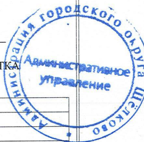
СХЕМА РАСПОЛОЖЕНИЯ ЧАСТИ ЗЕМЕЛЬНОГО УЧАСТКА НА КАДАСТРОВом ПЛАНЕ ТЕРРИТОРИИ