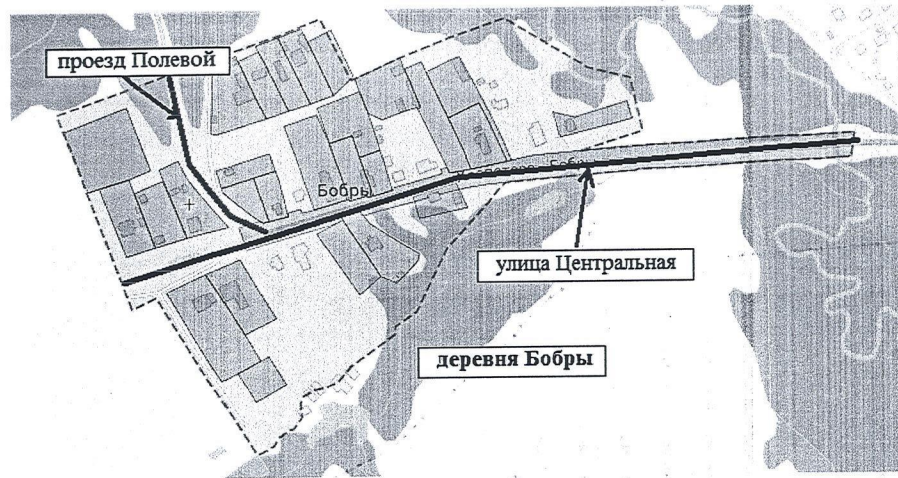
Схема присвоения наименования элементам улично-дорожной сети – улица Центральная, проезд Полевой, расположенных в деревне Бобры городского округа Щёлково Московской области

Начальник Отдела архитектуры и градостроительства Администрации городского округа Щёлково