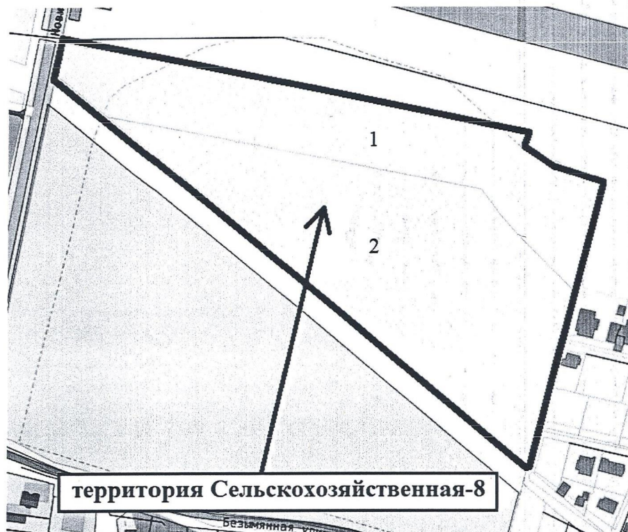
Схема расположения территории Сельскохозяйственная-8, расположенной в кадастровом квартале 50:14:0040371 городского округа Щёлково Московской области

Начальник Отдела архитектуры и градостроительства Администрации городского округа Щёлково