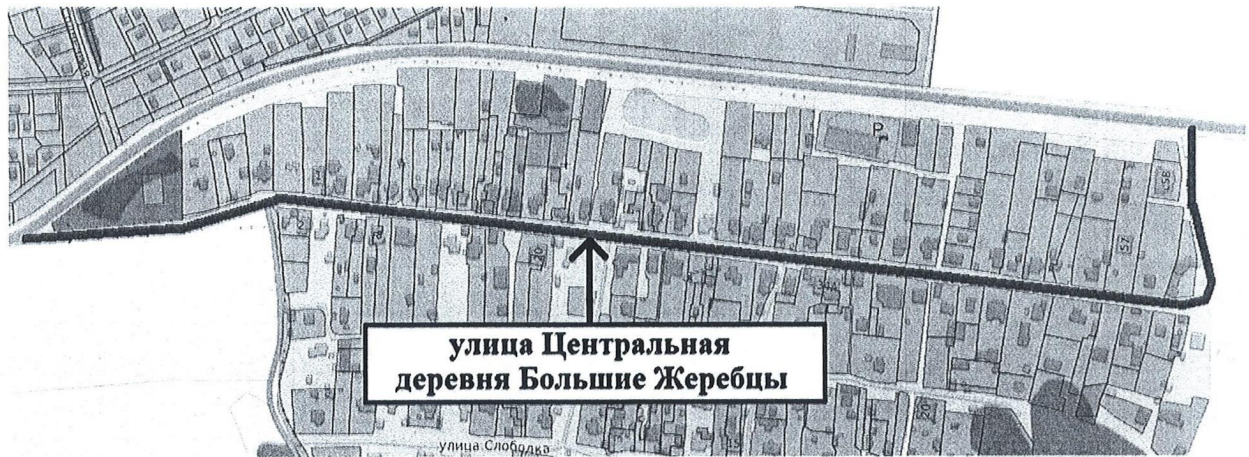
Схема присвоения наименования элементу улично-дорожной сети – улица Центральная, расположенному в деревне Большие Жеребцы городского округа Щёлково Московской области

Начальник Отдела архитектуры и градостроительства Администрации городского округа Щёлково